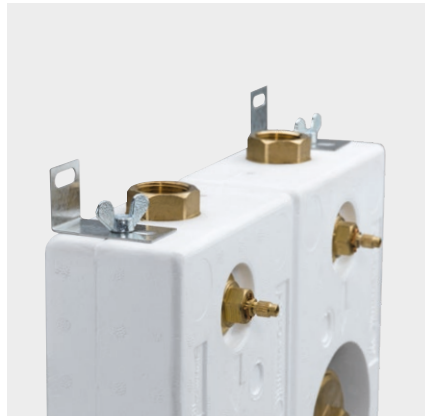
Befestigungsdarstellung inkl. Montagewinkel