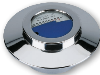
UP-Kompaktzähler für modulares Funksystem (ECO)