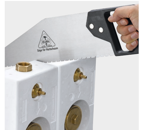
Trennung des Montageblocks (zum Singleblock) mit handelsüblicher Säge